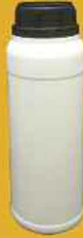
1 lt Şişeler