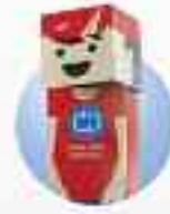
ARAS GERİ DÖNÜŞLÜ