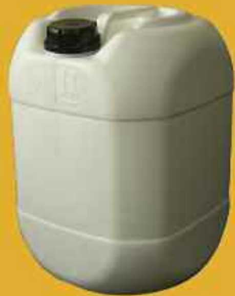
20 lt Bidon

Ne Sunduğunuz Kadar Nasıl Sunduğunuz da Önemlidir.