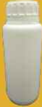
500 ml şişe