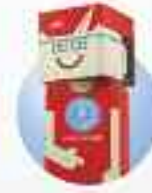
ARAS GÜN İÇİ