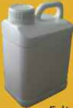
5 lt Bidonlar